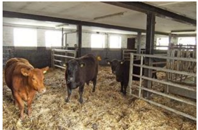
Tiefaufstall für Mutterkühe mit Sommerweidegang

Ab dem 01.01.2022 gilt die neue EU-Öko-VO, wir informieren im Laufe des Jahres 2021, sobald die Details bekannt sind.