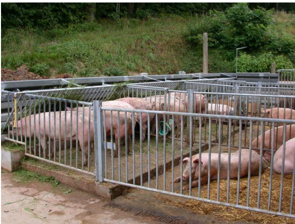
Schweineauslauf mit Fressplatz