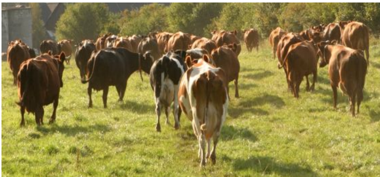
Weideaustrieb Milchkühe im Frühjahr