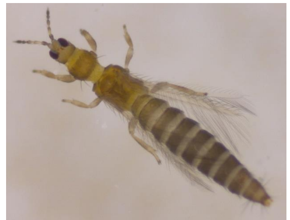
Abbildung 1: Aussehen des Kalifornischen Blüenthrrips, Schifferstein LLH