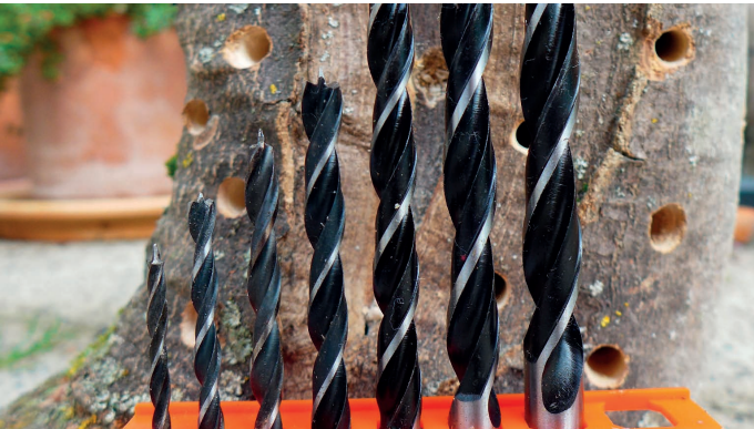
Für die Bohrlöcher sollten Bohrer von 2 - 9 mm verwendet werden. Anschließend Bohrlöcher glatt schmirgeln.