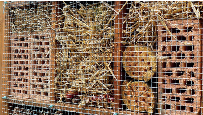
Insektenhotels sind häufig falsch konzipiert. Ziegelsteine machen nur Sinn, wenn sie mit Schilf- oder Bambushalmen befüllt sind.

Die überwiegende Mehrzahl der in Bau- und Gartenmärkten zu günstigen Preisen angebotenen Insekten-Hotels sind falsch konzeptioniert und zudem falsch konstruiert. Sie sind daher als Nisthilfe für Wildbienen weitgehend ungeeignet. Wir empfehlen aus diesem Grund den fachgerechten Selbstbau unter Berücksichtigung der im folgenden genannten Empfehlungen oder den Kauf professioneller Nisthilfen namhafter Hersteller.