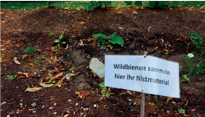
Offene Lehmkuhlen liefern Wildbienen Baumaterial.