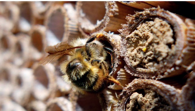
Sauber gesägte Schilfstängel.

Potenzielle Arten: Rote Mauerbiene, Löcherbiene, Scherenbiene, Blattschneiderbiene, Maskenbiene, etc.