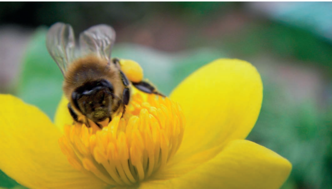
Frühblüher bieten Bienen das erste Nahrungsangebot im Jahr.