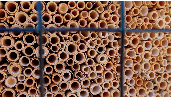
Ein Maschengitter schützt die Brutröhren vor Vögeln.

Potenzielle Arten: Keulhornbiene, Mauerbienen, Maskenbienen, Blattschneiderbienen, etc.