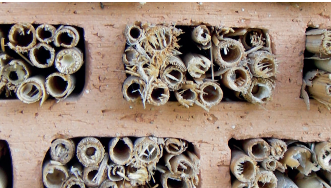
Die Kanten der Halme müssen sauber geschnitten bzw. gesägt sein.