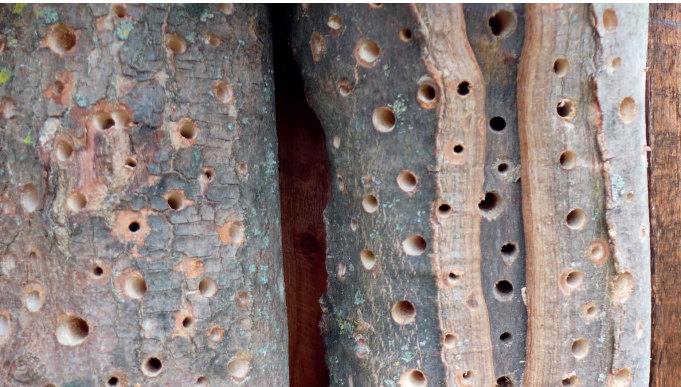
Sauber gebohrte Nisthölzer (Hartholz) werden gut von Wildbienen angenommen.