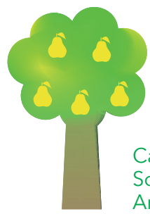
Ca. 25 verschiedene Sorten im erwerbsmäßigen Anbau in Deutschland

Ansprüche Klima: warm und geschützt Sorten: weltweit ca. 5.000 Meistangebaute Sorten in Deutschland: Alexander Lucas, Conference, Abate Fellet, Williams Christ, Clapps Liebling, Gellerts, Butterbirne, Köstliche aus Charneux, Vereinsdechantsbirne Saison: August - März Im Handel erhältliche Sorten: wenige, regional unterschiedlich