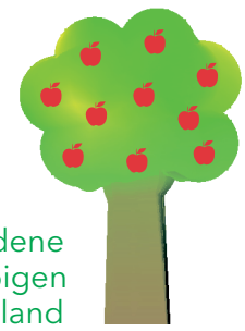
30 - 70 verschiedene Sorten im erwerbsmäßigen Anbau in Deutschland

Ansprüche Klima: weniger empfindlich (sortenabhängig) Sorten: weltweit ca. 15.000 - 30.000 Meistangebaute Sorten in Deutschland: Elstar, Braeburn, Gala, Jonagold und Jonagored Saison: fast ganzjährig Im Handel erhältliche Sorten: ca. 20