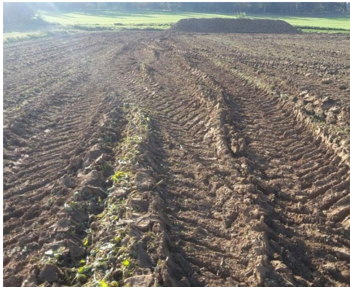
Abb. 1: Ernte unter zu feuchten Bedingungen kann zu verringerter N-Effizienz in der Folgekultur führen.

Im Hinblick auf die neue Düngeverordnung, gewinnt das Thema N-Effizienz – also die Menge des eingesetzten Stickstoffs im Bezug zu der mit dem Erntegut abgefahrenen Menge Stickstoff – an Bedeutung. Aber auch ökologische und ökonomische Faktoren, hinsichtlich schwankender Erträge und Erzeugerpreise, motivieren den Landwirt stetig zu einer Verbesserung der Nährstoffeffizienz, insbesondere bei Stickstoff. Zunehmend rücken durch den Klimawandel auch Wetterextreme in den Fokus. Speziell die Stickstoffversorgung der Pflanzen in vermehrt auftretenden Trockenphasen ist zu beachten. Gerade nicht veränderbare Faktoren wie Standort und Klima haben eine wesentliche Bedeutung und begrenzen den Landwirt hinsichtlich einer Steigerung der N-Effizienz. Einfluss auf die N-Effizienz kann insbesondere über Menge, Form und Verteilung des Stickstoffdüngers genommen werden. Aber auch über die Bodenbearbeitung, Grunddüngung, Pflanzenschutz und Fruchtfolge kann indirekt Einfluss genommen werden. Grundsätzlich wirken sich alle acker- und pflanzenbaulichen Maßnahmen, die der Ertragsstabilität und der Ausschöpfung des standortbedingten Ertragspotenzials dienen, positiv auf die Effizienz des eingesetzten Stickstoffdüngers aus.