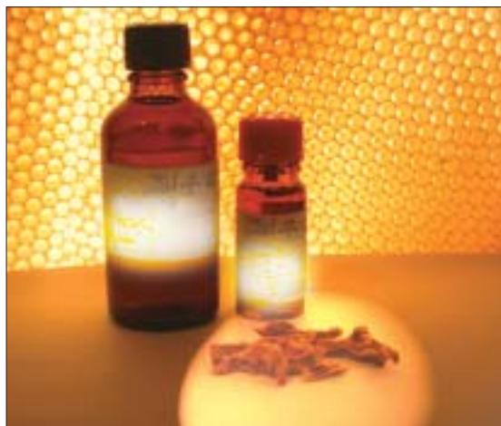
Für den Hausgebrauch kann man Roh-Propolis zu einer Tinktur oder zu Cremes verarbeiten.